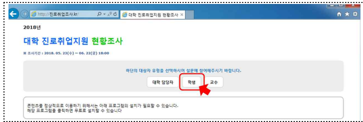
<조사 방법별 접속 방법>

※ ‘학과(전공)별 학생추출 매크로’ 는 조사 웹사이트에서 다운로드 가능